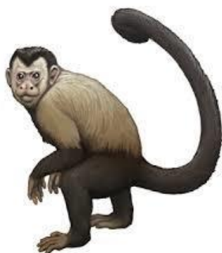
左から日本猿、オマキザル どちらもいわゆる「おサルさん」 モンキー（Monkey）です。

左からチンパンジー、テナガザル 他にはゴリラ、オランウータン などの類人猿は尾の骨が短く 人と同じように「しっぽ」は ありません。