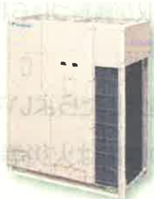
ビル用マルチエアコン