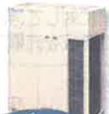
ビル用 マルチエアコン