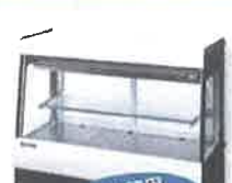
冷凍冷蔵用 ショーケース