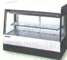
冷凍冷蔵用ショーケース など