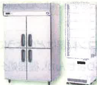
業務用冷凍冷蔵庫